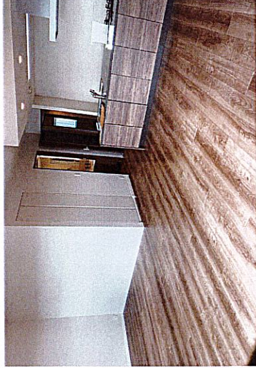
1-F type 2LDK